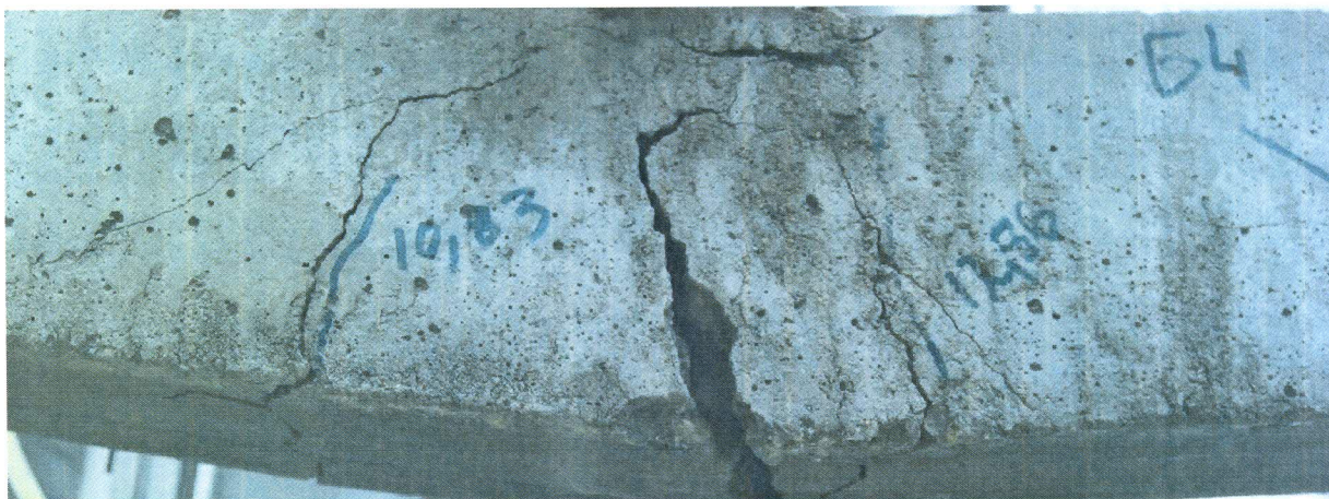
Рисунок 1. Балка №4 - образование трещин.